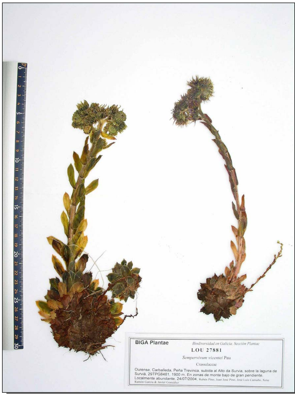
Imagen del pliego de referencia para la cita de Sempervivum vicentei Pau en Ourense : Carballeda, Peña Trevinca, subida al Alto da Survia, sobre la laguna de Surviá, 29TPG8481, 1900 m, En zonas de monte bajo de gran pendiente, Localmente abundante, 24/07/2004, R. Pino, J.J. Pino, J.L. Camaño, X.R. García & J. González, LOU 27881, mencionado en la página 104 de este trabajo.